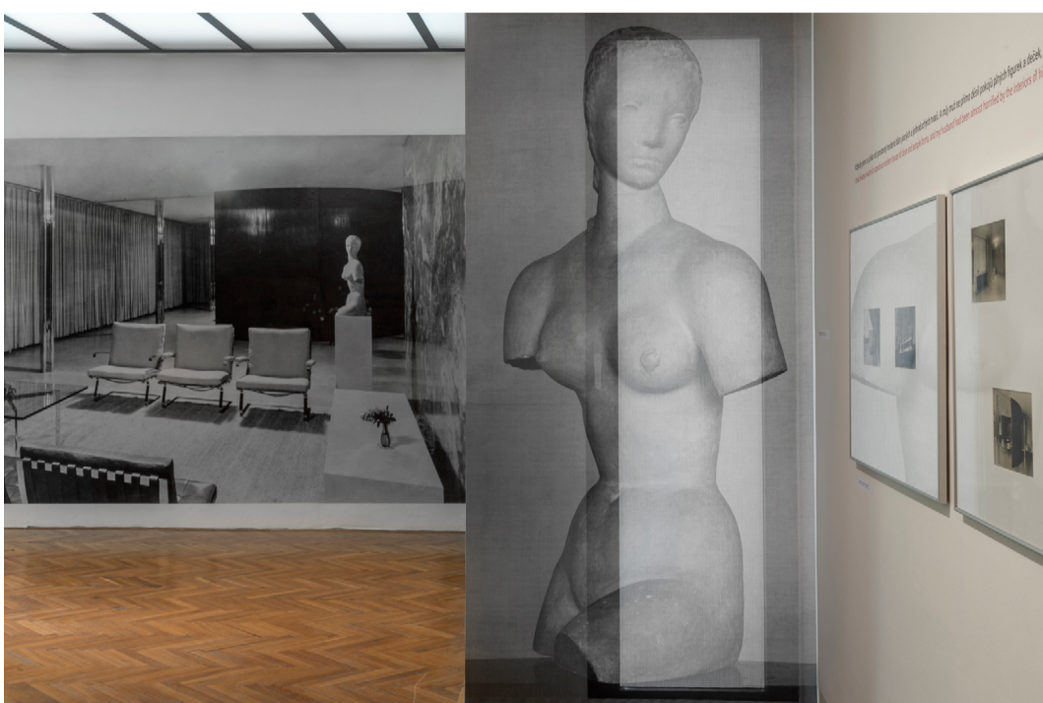
Výstava Mies v Brně / Villa Tugendhat