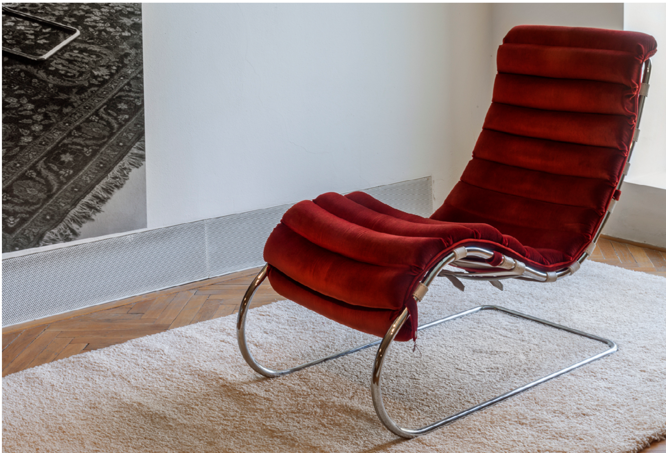
Ludwig Mies van der Rohe a Lilly Reich, lehátko MR 100

Výstava Mies v Brně / Villa Tugendhat představuje mimo jiné originální kusy nábytku z původního zařízení vily ze 30. let. Nábytek, který se řadí k ikonám světového designu 20. století, navrhl samotný architekt vily Tugendhat Mies van der Rohe společně se svou tehdejší přítelkyní Lilly Reich.